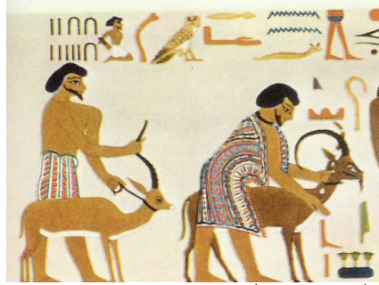
על פסוֹתוֹ גְּדָלִים... קטע מציור קיר בקבר חנוס חותפי II

22 שנה = מעגל שלם = (בראשית מו' 27) = כֹּל-הַנֶּפֶשׁ לְבֵית-יַעֲקֹב הַבָּאָה מִצְרַיִמָּה... בשנת 1927- לפנה"ס 6 לפרעה ח' חיפר: [אל-ישר] = [15+22] = [37] = [ישראל]