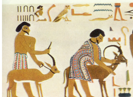
קטע זה של ציור הקיר כולל את שם אֶבְיִשִי והמספר 22 + 15 = 37

שְׁימור כְּמוֹת: [אל-ישר]=[22+15]=[ישראל] משמר תיעוד למסר היסטורי המתאר את ירידת יַעֲקֹב לַמִּצְרַיִם, בכתובת שיוחסה ליוסף "צִפְנַת פְּעִנַח" ותוארכה לשנת 6 למלכות פרעה ח'-חיפּר, בצויר הקיר במקדש קבר הנסיך חנום חותפ' II.