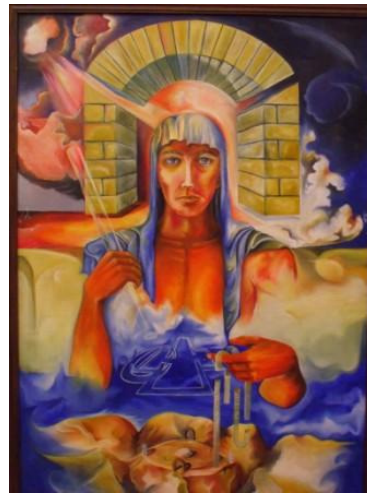
וְהָנָה אִישׁ-אֶחָד לְבוּשׁ בְּדִים... = (דניאל י" 5) הציור נמצא באתר: www.rami-nir.com = "תקוות".

אז נזכור, כי באזניו של דניאל הצדיק הושמע חזון קץ, מפיו של האיש לבוש הבדים... = (דניאל י"ב 7) = וְכָכֵלֹת נִפְץ יָד-עַם-קִדְשׁ--תִּכְלֶינָה כָּל-אֶלֶה... כאות לסמל את סיום כל המלחמות עם ניפוץ אבן השתייה.